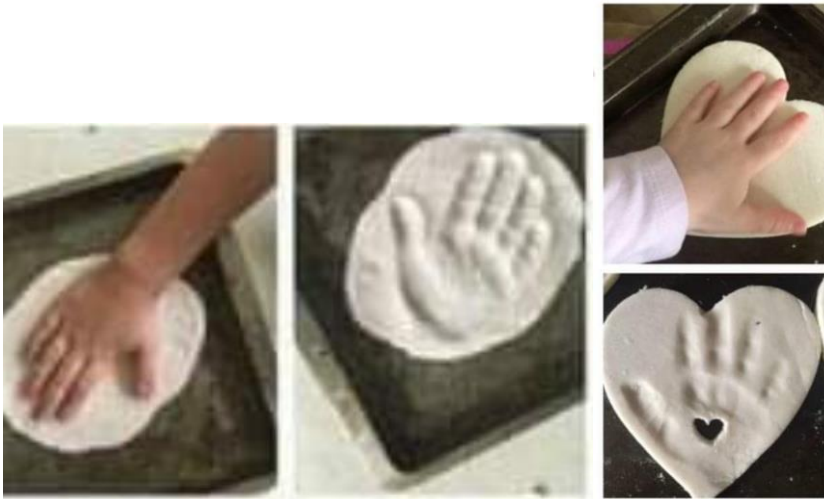
IMAGEM DO PASSO A PASSO:

FAMILIA POR FAVOR ENVIE UMA FOTO DA ATIVIDADE E DEPOIS ESCREVA COMO FOI ESSE MOMENTO DE MODELAR A MÃO DA SUA CRIANÇA NA MASSINHA: